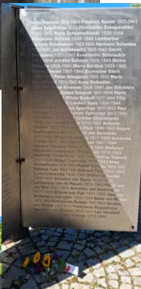
Onder: Theo en Ans bij het Buch der Erinnerung.