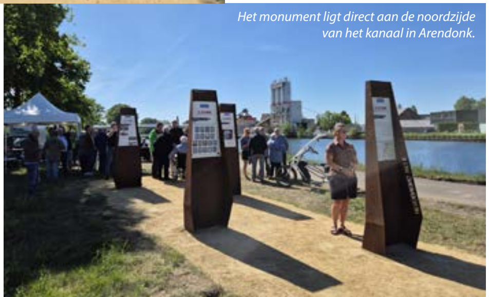
Het monument ligt direct aan de noordzijde van het kanaal in Arendonk.

We mogen hun offers nooit vergeten. Zij kwamen van ver, staken grenzen over, en gaven hun leven op vreemde bodem — voor onze vrijheid. Laten we stilstaan bij wie ze waren: jonge mensen, met dromen, gezinnen, een toekomst. Vandaag herdenken we niet