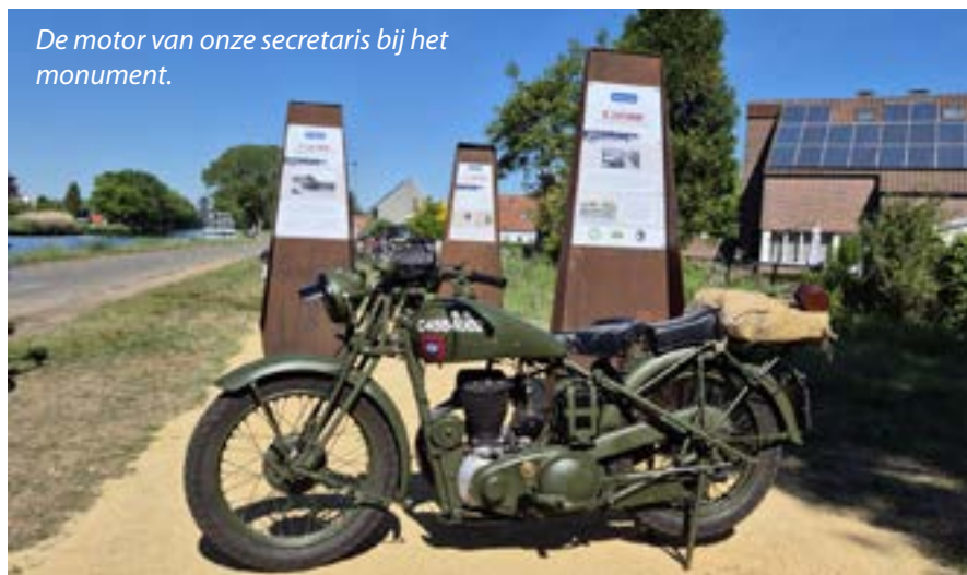
De motor van onze secretaris bij het monument.

Het regende voortdurend pijpenstelen en er stond een hevige wind. Straten en velden werden herschapen in een modderige brij en onder die omstandigheden probeerden de MONS door te stoten tot aan de weg Arendonk-Eindhoven.