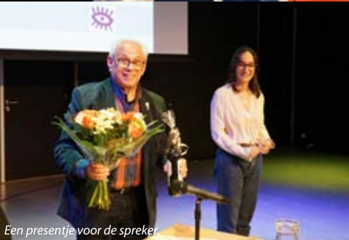
Een presentje voor de spreker