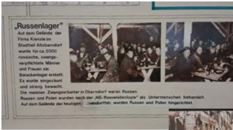
Afbeeldingen van de expositie in het stadarchief van Oberndorf.

hun gedwongen verblijf was heel bijzonder. Ook de opmerking uit het dagboek dat het een “kookpan” was werd duidelijk zichtbaar. De stad Oberndorf am Neckar is gelegen in het dal van de Neckar. Het geheel is omgeven door heuvels. Wij mochten ook ervaren wat een “kookpan” was bij 34 graden. Het dorp en de Mauserfabriek werden door staalkabels ( vliegersperre ) tussen de heuvel beschermd tegen bombardementsvluchten door de geallieerden.