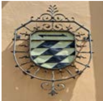
Het stadswapen van Oberndorf am Neckar aan de muur van een gebouw.

Als stichting proberen we verbindingen te leggen en begrip te kweken voor elkaar. We