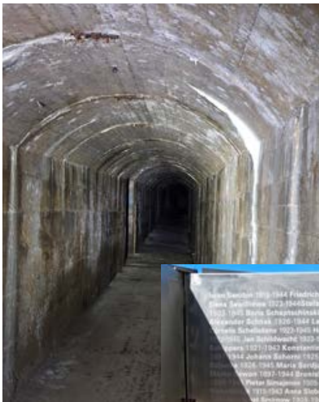
Boven: De ondergrondse gangen.