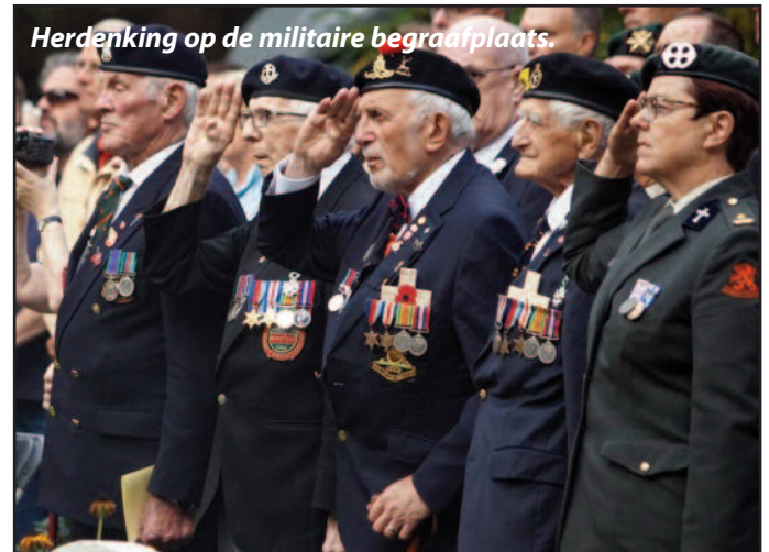
Herdenking op de militaire begraafplaats.

Diverse organisaties hebben het idee opgepakt om iets te organiseren voor de herdenkingsweek van 14 tot 22 september. Zo zal onze stichting een expositie houden waarover wij u al regelmatig hebben geïnformeerd. Verder zullen wij in de