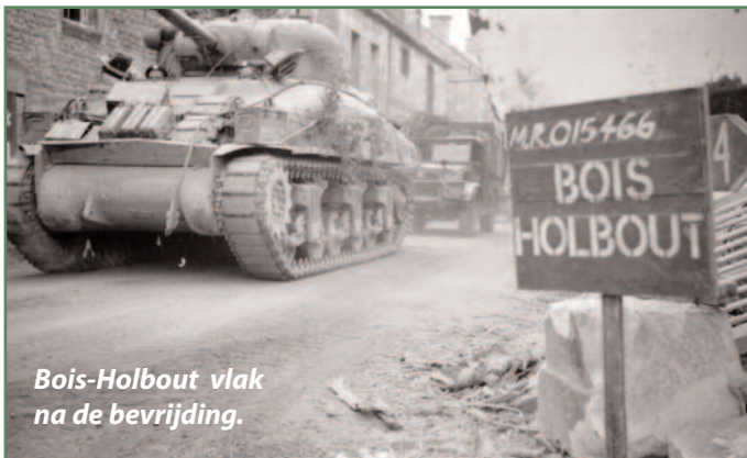
Bois-Halbout vlak na de bevrijding.

Hierna begonnen de Duitsers de tanks te beschieten met 88 mm kanonnen en de Britse tanks braken de aanval af. De infanterie zette de aanval door en kwamen in het dorp. Terwijl Owen met