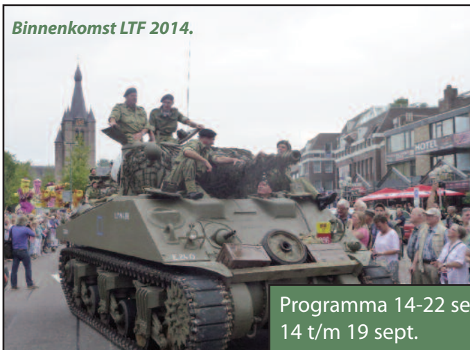
Binnenkomst LTF 2014.

Op 15 september van 11:00 tot 17:00 organiseert Modelvliegclub Valkenswaard hun tweede editie Bevrijdingsvliegen op het modelvliegveld aan de Peedijk in Borkel & Schaft. Er wordt gevlogen met diverse radio-bestuurbare vliegtuigen uit de eer-