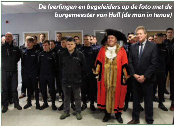
De leerlingen en begeleiders op de foto met de burgemeester van Hull (de man in tenue)

comfortabele overtocht kwamen we daar op 15 februari in de vroege ochtend aan.