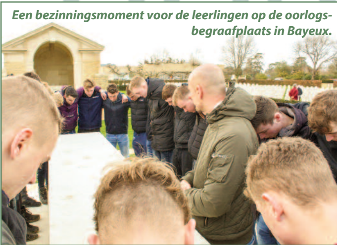
Een bezinningsmoment voor de leerlingen op de oorlogsbegraafplaats in Bayeux.

de leerlingen meer konden ervaren over het leven van de tankbemanningen tijdens de oorlog.