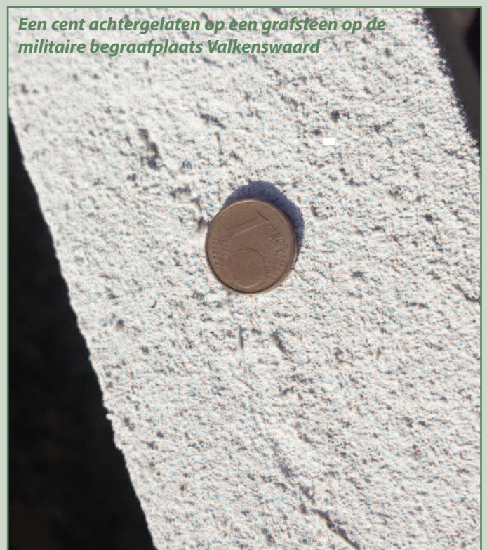
Een cent achtergelaten op een grafsteen op de militaire begraafplaats Valkenswaard

wezig is. Het is een plek waar de levenden en doden nog in contact met elkaar kunnen komen. Door er een steen op te leggen, leveren de nabestaanden een blijvende bijdrage aan die grafsteen. Ze laten een teken achter dat laat zien dat ze op bezoek zijn geweest, dat de gestorvene geëerd wordt en niet vergeten is. Het gebruik om stenen op graven te leggen, gaat vermoedelijk terug tot de tijd dat de joden nog een woestijnvolk waren. Mensen werden in die tijd daar waar ze stierven begraven. Om het graf in de woestijn te markeren en om te voorkomen dat de overledene door aas etende dieren werd opgegraven, legden ze er stenen op. Nomaden op doortocht vulden uit respect voor de dode vaak de stenen weer aan. Door de eeuwen heen kreeg het leggen van de stenen op de graven een symbolische waarde. Stenen vergaan niet zoals bloemen, die door christenen als eerbetoon op de graven worden gelegd. Ze hebben eeuwigheidswaarde, die je terugvindt in het eeuwigdurend grafrecht van joodse graven, die volgens de geloofstraditie niet geruimd mogen worden. De onvergankelijkheid van de stenen staat ook voor eeuwige liefde en geloof, altijd durend respect, een herinnering aan en verbondenheid met de dode. De steentjes op de militaire begraafplaats worden wel geruimd door het CWGC. Iets wat heel begrijpelijk is. Dit omdat er anders na jaren geen grafsteen meer te zien zou zijn maar alleen een hele berg stenen. Dit zou afbreuk doen aan de uniformiteit en netheid van de begraafplaats. ●