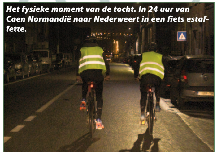
Het fysieke moment van de tocht. In 24 uur van Caen Normandië naar Nederweert in een fiets estafette.

Na het museum zakten we verder af naar Portsmouth. Veel militairen trainden rondom Portsmouth en scheepten daarin om de reis naar Normandië te ondernemen voor de invasie van het door de Duitsers bezette Europa. Op de plek van het D-Day memorial vertelde ik de leerlingen het verhaal van de trainingen en de inschepingen waarna we gingen dineren en zelf ook inscheepten om richting Normandië, Frankrijk af te varen.