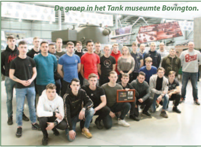
De groep in het Tank museum te Bovington.